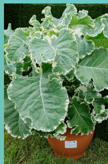
Chou 'Crème Chantilly' Hortiflor-Bureau